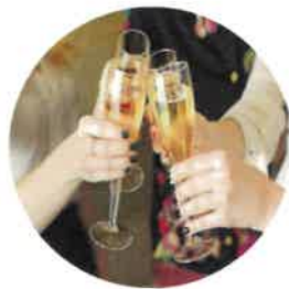
네트워킹 자유로운 분위기의 파트너SHIP