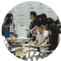
케이터링 참여기업을 위한 만찬