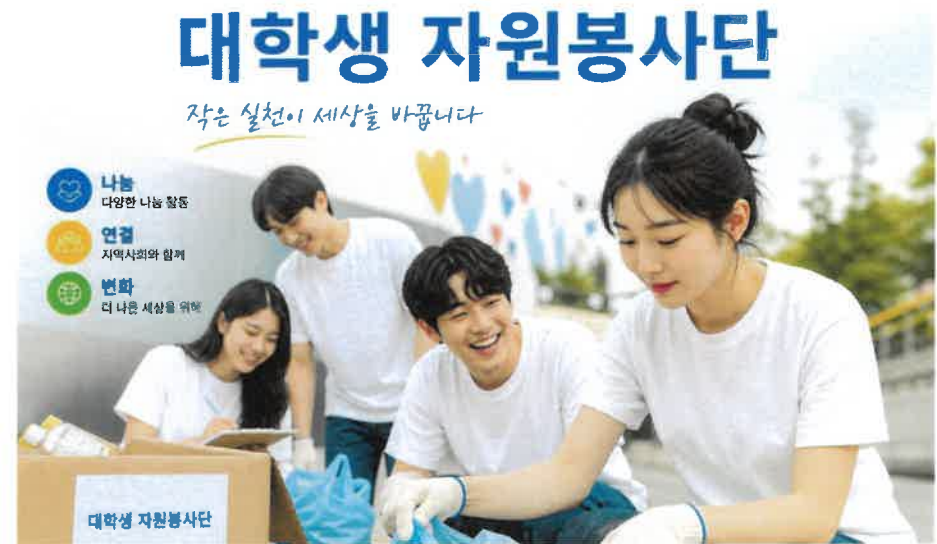
본 이미지는 시로 생성된 가상의 이미지입니다.

대학생 자원봉사단의 적극적인 참여로 현장 운영의 효율성을 높이고, 관람객과의 소통 및 참여를 이끌어내 활기찬 행사 분위기 형성