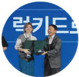
럭키 드로우 경품 추첨 프로그램